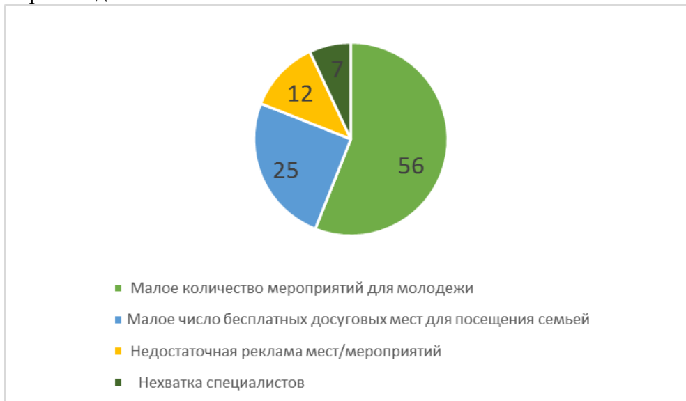
Рис. 2. Проблемы в сфере развития культуры Краснокамского муниципального образования (% от ответивших)

витию культурной среды в Краснокамском городском округе. Так, в муниципальной программе «Развитие культуры и молодежной политики в Краснокамском городском округе» выделяются следующие аспекты, требующие проработки: нехватка доступных культурных событий для разных возрастных и социальных групп населения, недостаточное внимание к сохранению и продвижению культурного наследия, что соответствует ключевым проблемам, выделяемым респондентами.