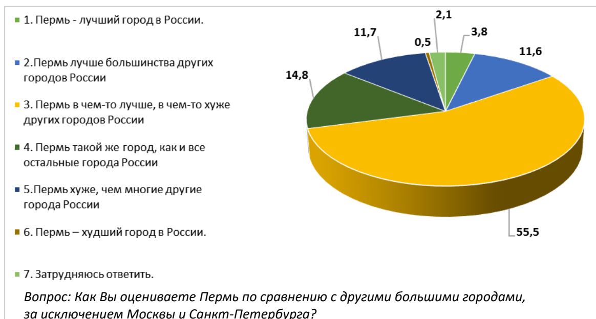
Рис. 3. Оценка Перми по сравнению с другими большими городами России, за исключением Москвы и Санкт-Петербурга?

Далее в ходе анализа выяснилось, что 70,3% молодежи, имеющей опыт посещения других больших городов России, оценивают Пермь на одном уровне с другими городами (варианты ответов «в чем-то хуже, в чем-то лучше», «такой же»). Пермь выглядит лучше иных городов в глазах 15,4% молодежи, и хуже других городов в глазах 12,2% молодежи. Соответственно, у молодых людей и девушек в целом нет особого негативизма по отношению к Перми, но нет и особого восторга.