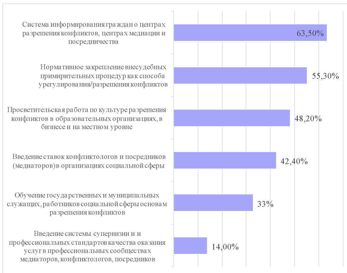
Рис. 2. Результаты ответов на вопрос «Что, по Вашему мнению, может ускорить процесс применения примирительных процедур в работе с конфликтами?»

Нами было предложено респондентам определить мероприятия, направления деятельности которых выступили бы стимулами развития примирительных процедур (медиации), ответив на вопрос «Что, по Вашему мнению, может ускорить процесс применения примирительных процедур в работе с конфликтами?» Варианты ответов были составлены на основании изученных литературных источников и консультаций с практикующими медиаторами. Участникам исследования так же, как и в предыдущем вопросе, предлагалось выбрать не более трех вариантов ответа и при желании выразить свое мнение в поле «Другое». Процентное соотношение ответов представлено на рис. 2.